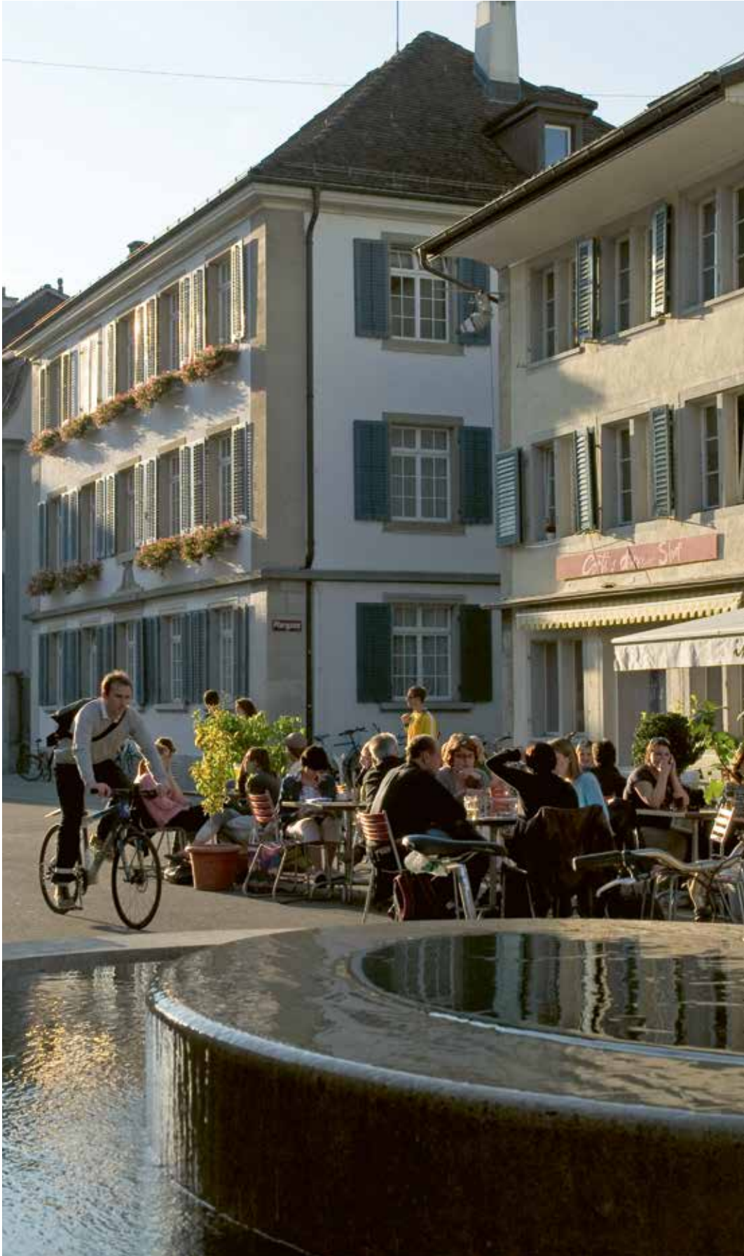
Judd-Brunnen Steinberggasse Winterthur