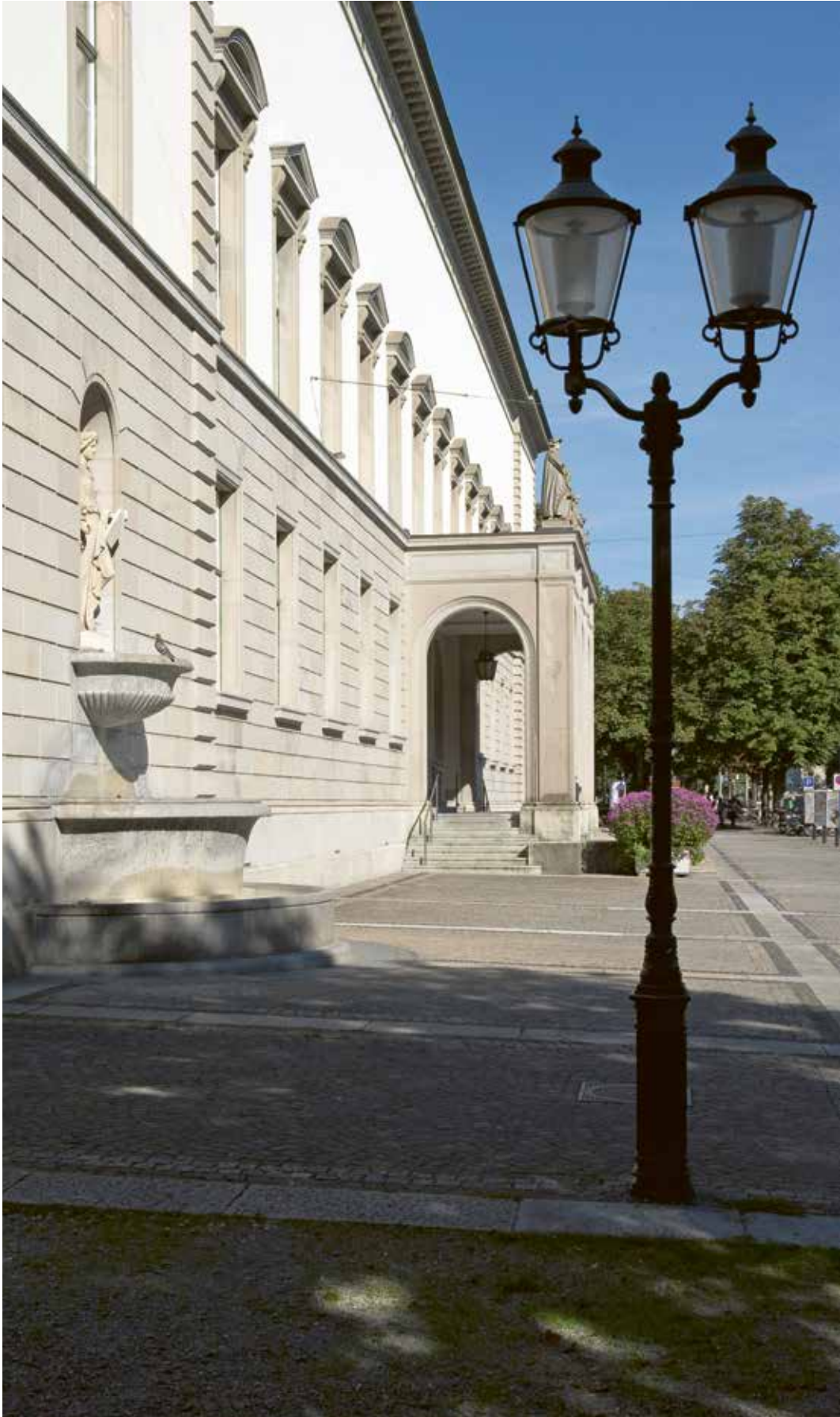
Kunstmuseum Winterthur | Reinhart am Stadtgarten